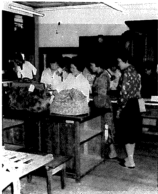
「これ、私がまだ小さいころ使っていたわよ」と、なつかしそうに見る

みなさん、教育委員会庁舎内にある民俗資料館をご存知ですか。ここには、当市で昔使われていた民具や農具を展示してある民俗資料室。それに、白根の凧をはじめ全国の凧、合戦の歴史や昔をしのぶ絵柄などを集めた凧資料展示室があります。ここに集められているものは、私たちのまちの歴史を物語る、貴重な文化財―祖先の労苦と生活の知恵のすばらしさが想い浮かべられます。 入場は無料で、平日は午前八時三十分から午後五時まで、土曜は正午まで開館しています。(日曜・祝日は休みです) なお、凧合戦期間中は、土・日曜とも平日どおり開館します。お問い合わせは、教育委員会社会教育課(☎②三二七)へ。