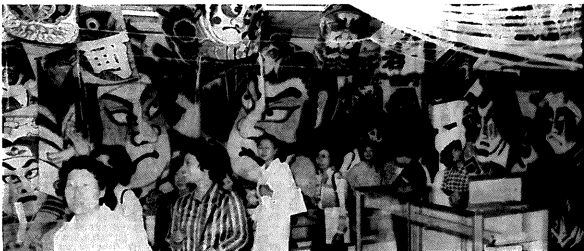
見事な絵柄の大小の凧がいっぱい。全国でも珍しい凧資料展示室に見学者もうっとり