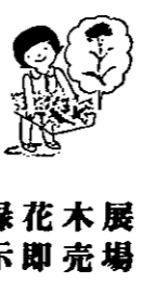
花木展 緑花即売場

■開設期間 六月三十日まで 午前八時三十分から午後六時まで ■入場料 無料 ■会場 白根市農協スタンドわき また、同会場で「さつきまつり」が六月一日から八日まで開かれます。期間中、毎日先着百人の方に、さつきの苗木を無料で差しあげます。 銘花 銘木の指導などの相談も行っています。お気軽にご来場ください。 さつきの生産者、愛好者もぜひ