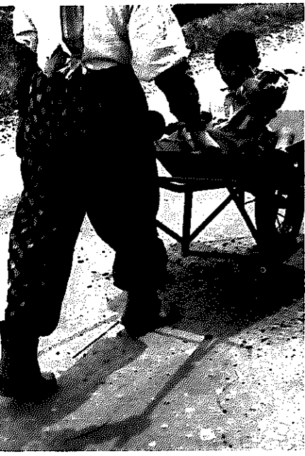
野良仕事を終え、疲れた足どり、ゆらゆら運転。母の愛がやさしくつむ

【ひとこと】 家庭は、最大の言語教育の場です。個人差がありますが、二歳くらいでは「パパいない」など、二語文ぐらいが出来るようです。赤ちゃんのときかまわってやらない、話しかけが少ないと遅れがちです。一緒に遊び、話しかけをより多く。 難聴口蓋裂や脳性マヒなどの場合は、専門機関にご相談を。