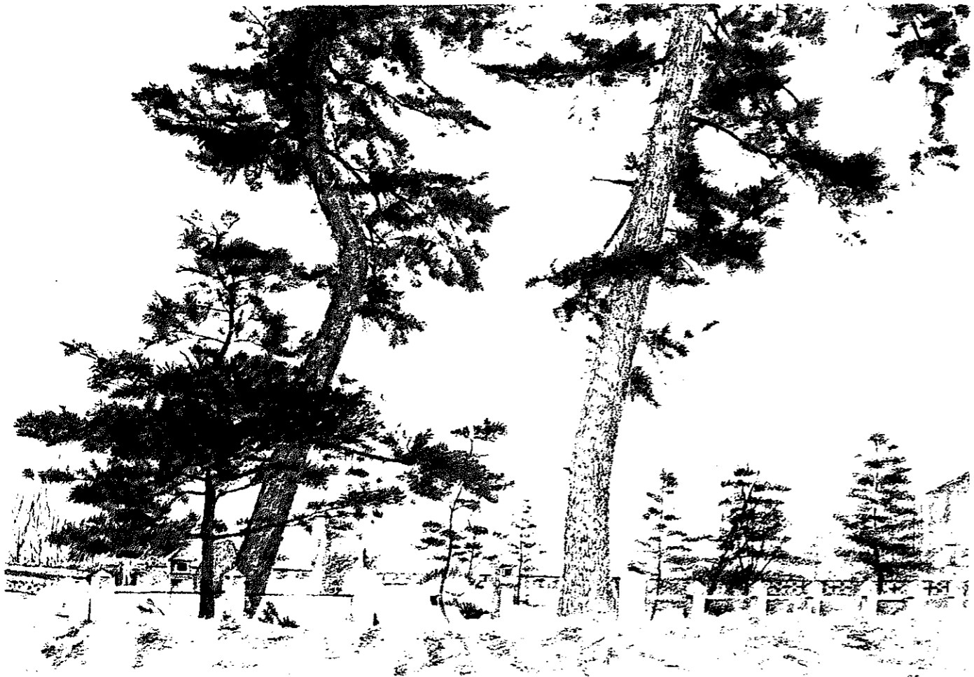
『芭蕉翁』したう石ぶみ