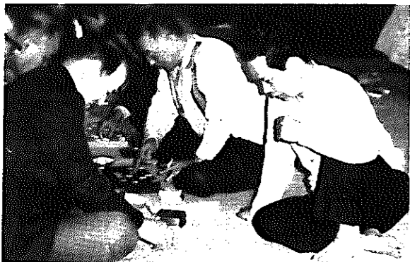
▲定例会では熱の入った星取り戦が…

す。この消耗品費が、市の財政が窮迫しているため、どの課(局、所、館)でも節減を余儀なくされています。図書館でもその支出には細心の注意を払ってきています。にもかかわらず、事務用消耗品費にさえこと欠くあり様で、館内に4種類を備えておくのが精いっぱいです。市内には、12か所の配本所があります。そのすべてに雑誌を備えることは、ほとんど望めない状況です。しかし、ここ数年雑誌の利用者が増えているし、少なくとも館内に備える雑誌の種類と数を増やし、ご要望に添うべく努力したいと思います。これからも、図書館に対するご意見などをお聞かせください。