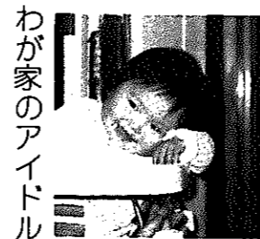
わが家のアイドル

ヤセウマは背負いの運搬具として、多く使われました。いろいろな型があり、背にあたる部分にはなわが巻いてあります。このヤセウマは大正5年ころ使用したものです。(市民俗資料館蔵)