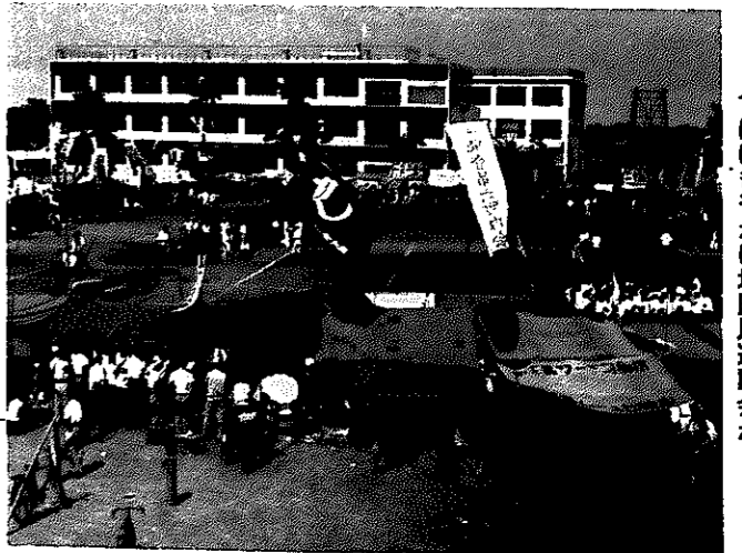
▲体育館建設のためのやぐらが見え、校庭ではにぎやかに地区民運動会が……

鉄筋コンクリート建校舎は白根町ではもちろん最初のもので、採光、防音、耐火等に優れ、完成のあかつきには郡内でも誇りうる中