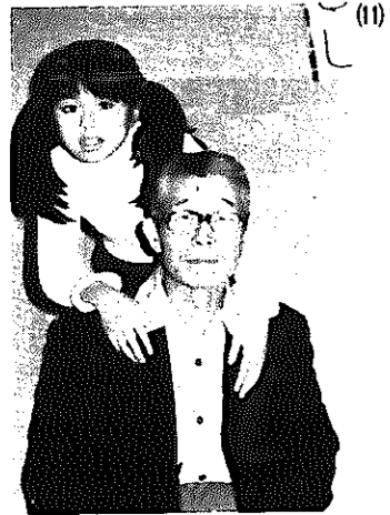
絵が上手なおじいちゃん