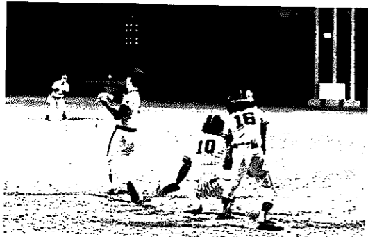
▲ナイターで野球を楽しむ(諏訪木運動広場で)

なお、屋外体育施設の開放は四月一日からです。四月中に野球場を利用したい団体は、三月十九日までに体育係へ申し込んでください。詳しいことは同係(☎七三・三二七二)へおたずねください。