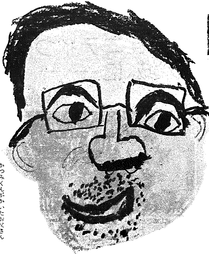
かつみくんがかいたお父さん

◇人口の動き 1月1日現在 人口33,174人(前月比+50) 男16,190人 女16,984人 世帯数7,266