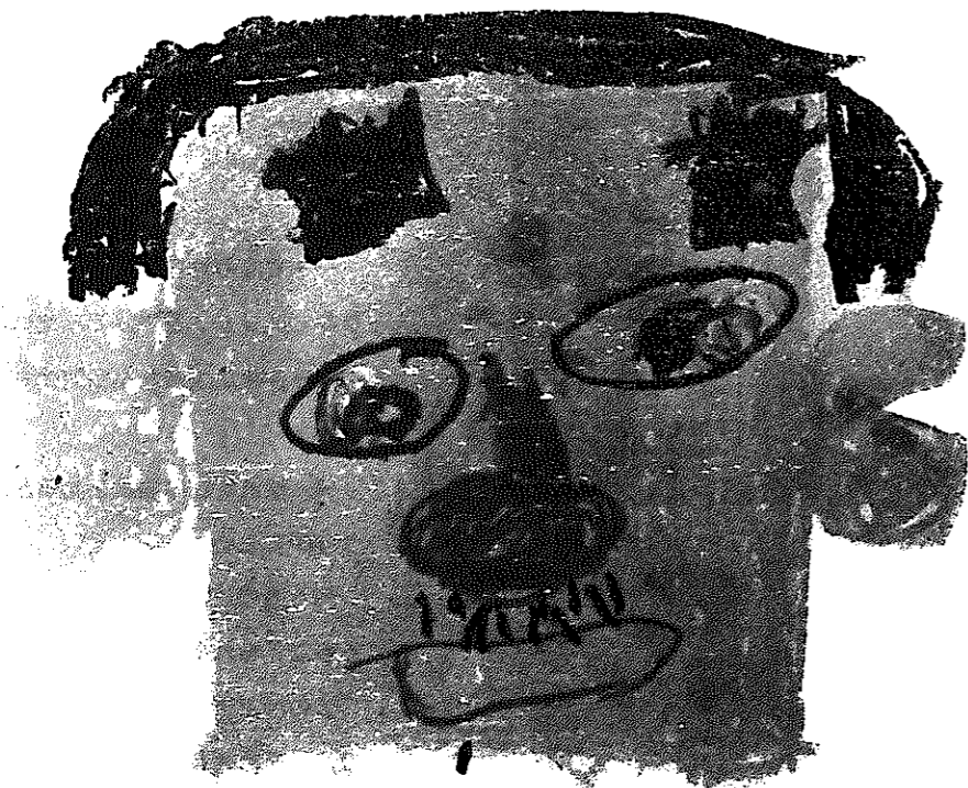
かずみちゃんがかいたお父さん