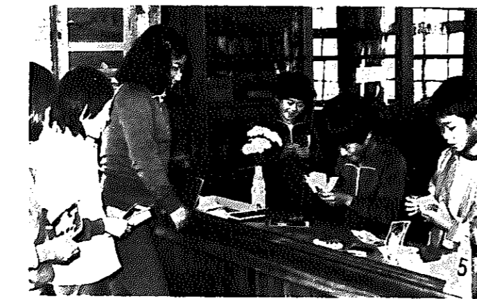
「しっかりかぞえて」「まかせておけて！」こんな会話も聞かれる楽しい貯金日。将来は、銀行員を志望する児童も——。

さんは「三年間で六千円くらい貯金しました。当時のお金としては相当な額でした。益づかいや祭りづかいをせつせと貯金した記憶があります」。 貯金は毎月一回。すべて運営は、児童の自主性にまかされています。「卒業したら自転車を買おうんだ」「花嫁衣裳の資金に」と、児童の夢もふくらみます。