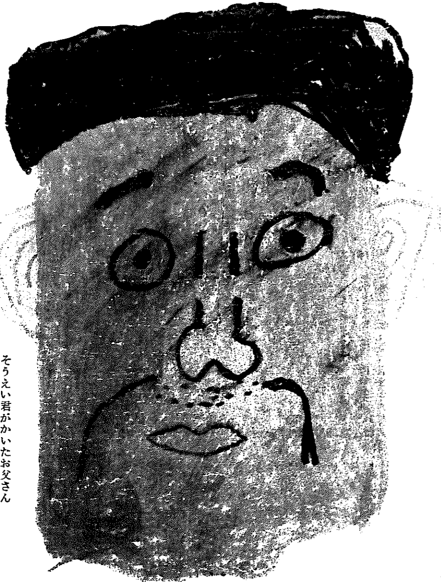
そうえい君がかいたお父さん

◆人口の動き 3月1日現在 人口32,998人(前月比+30) 男16,059人 女16,939人 世帯数7,196