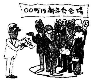
集会などの飲食代

政治家や候補者は、次のような場合を除いて、選挙に関係あるなにかかわらず、また、どのような名目であっても、選挙区内の人に寄付することはできません。