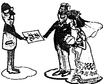
結婚のお祝い金やお祝い品