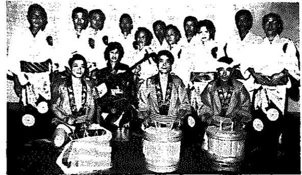
民謡は五、六曲。中でも、昔から伝えられてきた踊りを生かし、自分たちで補作した「鷺巻甚句」は自慢の一つだそうです。

しかしながら、民謡や踊りが好きだけで、笛や三味は使いこなせるものではありません。そこで月二回、新橋から講師を招き涙、涙の特訓を開始——こんな努力が、ようやく一年後に実り、今では、新潟祭りの民謡流しにも毎年参加。昨年はBSNテレビ放映の、春の唄祭りにも出場するまでに成長しました。佐渡おけさにもちろん、新潟甚句など、すでにマスターした