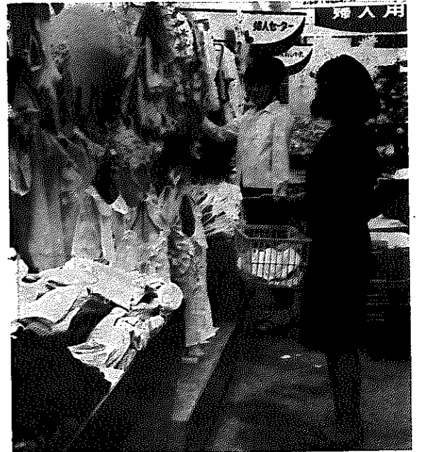
店舗のイメージアップにもお役にたちます。

こんなとき「少しでも経営者の皆さんの手助けをしたい……」と市や県では、これまでより融資額を多くするなど努力しています。——どうぞお気軽にご利用ください。