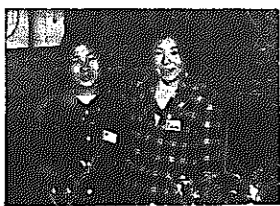
美さん 輝子 口さん 輝子 高井小5年

校舎も、現在のままでは小学生には向かず改築が必要です。これも、再建団体に指定されてから積み立ててきた、学校建設基金の一部をあて、新学期までには校舎、体育館の内装補修便所の改築、備品の購入などを行なう予定です。 また、統合であく校舎の利用について教育委員会では「地元の人たちと十分話し合って決めたい」と話していますが、一日も早く、地元の人たちが納得できる方法を、考えてもらいたいものです。