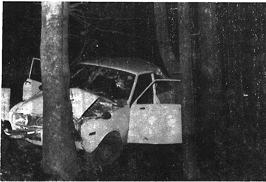
▲ このようになってからでは、遅いのです—朝捲地内での事故。

ピーポー、ピーポー。だれもが白い救急車の信号音を聞いた びに、背筋の寒い思いをするのではないのでしょうか。昨年の交 通事故は、一昨年より少なくなっているとはいえ、交通地獄の 業火は、まだ燃えさかっています。