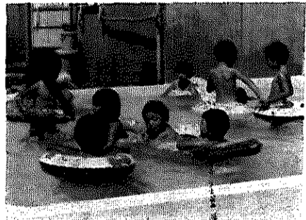
▶かっぱも顔まげ/水遊び

丈夫な子どもに育ててほしいとの父兄の願いから、古川保育園にプールが完成しました。プールは縦四・五、横三・四で、四日間の超突貫工事のこと。父兄の持ち寄り資材もとに、なれない手つきの勤務率仕づくりに思われたい、りっぱなできばえです。色とりどりのかわいらしい水着をつけ、小さな浮き袋を持つてはしゃぐ子どもたち。保育士の注意にうなずきながら炎天下に、元気がいっぱい水しぶきをあげて遊んでいます。