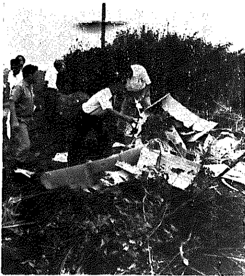
▲不法投棄/自らの手で、きたない町にするのはやめましょう

環境課では、建設省など関係機関と協力して信濃川、中の口川への不法投棄を調査するために、河川パトロールを行いました。中の口川沿岸は、ほとんど不法投棄は見つけられませんが、信濃川沿いの、西酒屋、上八枚、庄瀬第一、庄瀬橋のた