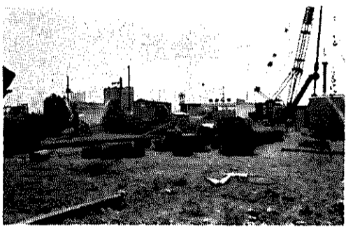
基礎くい打ち開始/ピッチあがる工事現場