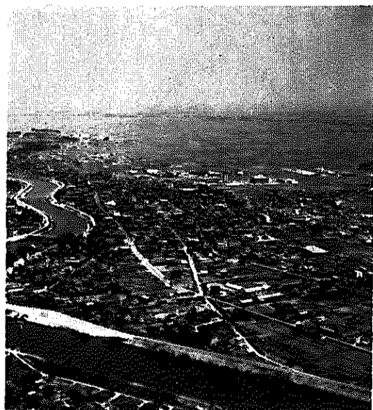
▲ 約333軒を対象に、秩序ある都市づくりが行われます。

をさけるため、敷地境界から一辺の外壁後退距離も設けられます。 いろいろな用途や形態の建物が無秩序に建ち、騒音、悪臭、日照妨害などで生活環境が破壊されたら大へんです。 建物を建てる場合、お互いが守るべき最低の規則を決めた用途指定、住居保護に重点をおいた制度といえます。