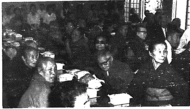
「ほんね極楽らてはー」。寒いところでの敬老会ともさようならー白寿荘を利用している小林地区敬老会。

お年寄りに夢をと、老人福祉センター「白寿荘」が開所してから三月一日で、満一歳の誕生日を迎えました。近代設備をほこり、二十五人乗りマイクローバス一台を持つ同センター。利用者も多く、中には新津市や小須戸町から訪れるお年寄りもあり、親しまれています。