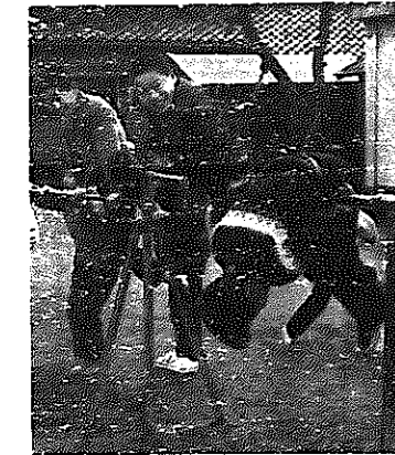
この子らが心身ともすこやかに成長してほしい……子を持つ親の願いです。

昨年の四月一日から、十八歳未満の児童を三人以上養育している人で、三人目以降の児童のうち十歳未満の児童がいる場合一人につき月額三千元の児童手当が支給されています。これが、今年四月一日から児童手当が引き上げられ、養育終了前の児童(中学を卒業するまでの児童)がいれば支給されます。この支給条件として、一定の額の収入(たとえば扶養親族五人の場合二百六十八万円)この額は、今年六月から引き上げられる予定です。なお、養育学校の中学部に在学する児童などには特例がありますので、ご相談ください。