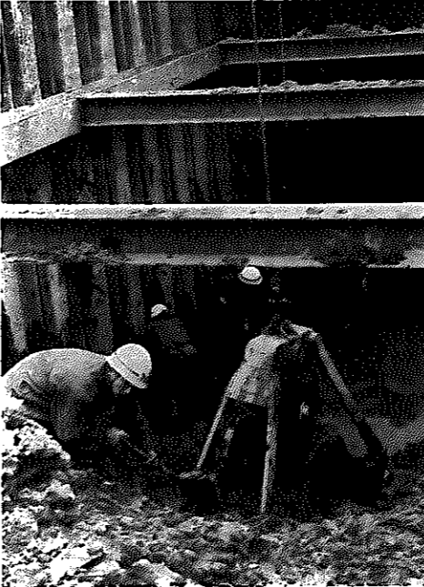
▲ 人力や機械力を駆使しての下水路工事