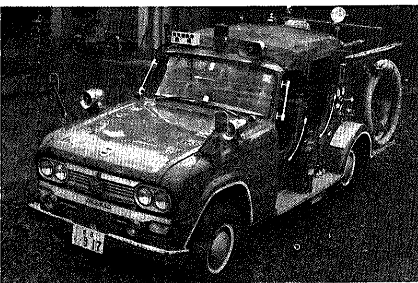
活躍が期待される最新鋭の消防車

在の職員二十二人で業務を行ないますが、近い将来にはさらに十一人の増員をはかり、合計三十三人の職員で業務に当たることになっていきました。 また、中之口村六分地内に分遣所(木造平屋建六十六平方メートル)も建設される予定になっており、そこには消防車一台と職員七人が常駐し、非常時に備えることになりそうです。 それから、新しい消防本部と消防署の名称は「白根地区消防本部」「白根地区消防署」となり、庁舎は市の消防署庁舎をそのまま借用して業務に当たります。したがって電話番号もこれまでと変わらず普通通のときは七二一三一一番です。 消防車(火災)が到着 日本損害保険協会が、全国各自治体の消防体制強化に協力して、年々行なっている消防自動車の寄贈は、ことしで十八年目を迎え、すでに全国で五百六十二台の消防車(火災保険号)が活躍しています。そして、ことしも第一次分として本市を含む二十六の市や町に「火災保険号」が贈られることになり、十月二十七日東京明治神宮外苑絵画館前広場で合同贈呈式が行なわれました。