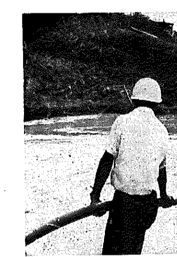
決壊したか所から濁流が……下八枚

今年には台風の当たり年 またこれから要注意になってくるのが台風です。数々のデータからことしは台風の当たり年になっており、発生数は少ないが大型のものが上陸しそうな気配です。気象庁のデータによれば、六月までの発生数が少ない年は年間を通じて少ないが、大型の台風が上陸しています。ことしは六月までに三箇所か発生しておらず、戦後六月までの発生数が三箇以下だったのは二十二年、二十四年、二十七年、二十九年、三十四年と