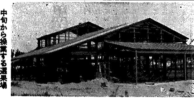
中甸から操業する選果場

この施設を利用するよう、センターの利用手続きなどを紹介してゆきます。団体を利用する場合、センターの利用者を大別すると①センターが主催する行事の参加者②青年団体③個人の三つに分けることができます。