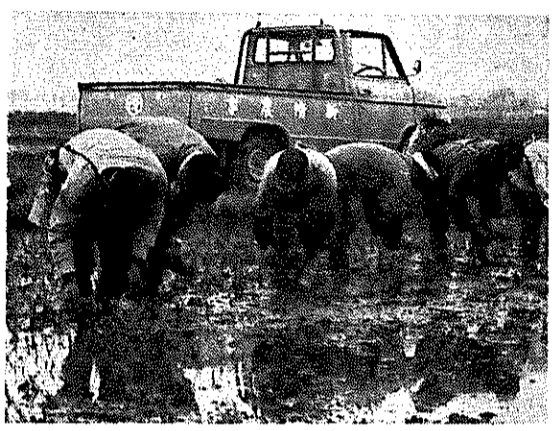
市内に160人の援農者

市内で家族全員が赤痢に罹ったことは毎年耳にしませんが、保育園、学校、職場での集団発生はほとんど聞きません。