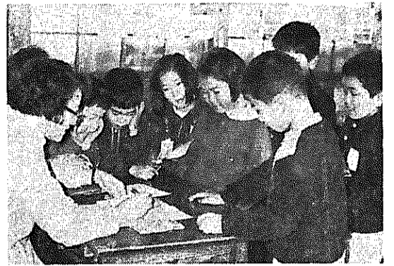
子ども銀行がないため教室で先生がお金を受け取って親銀行へ持ってゆきます。(戸石小で)