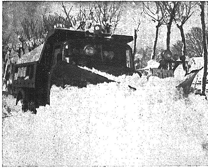
交通路線の確保に活躍した除雪車

昨年の十二月三十一日から降った雪は、県内に下大雪をもたらしました。市内にも、多いところで一・三メートルの積雪があり、一時は交通マヒ状態になりましたが、元日朝からの除雪で一応回復することができました。