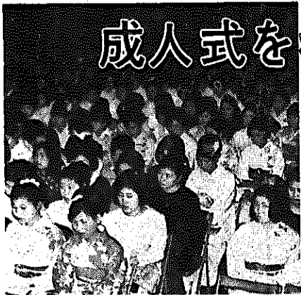
和服姿が目立った 昨年の成人式