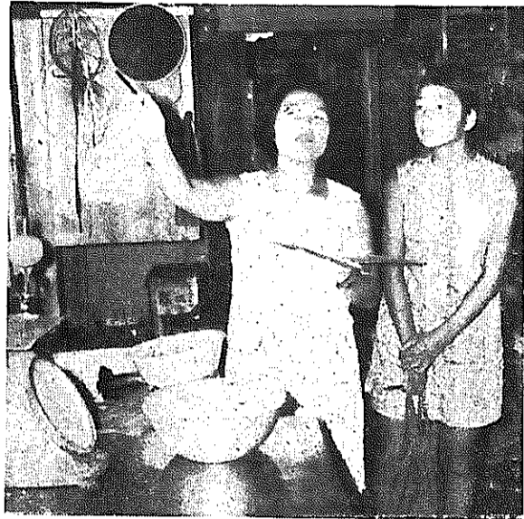
「ここはどうかしら…」と監視員の目ははしる

8月5日、市内3組の母子は、新津保健所から「一日食品衛生監視員」に委嘱され、市内約20店の食品業者の店を見てまわりました。この結果、「突然うかがったわりには全体的に設備が整っており、衛生的だと思った。とくにハエやゴキブリなどは1びきも見当たらず、業者のかたが日ごろいかに衛生について気を使っているかがよくわかった。しかし一部の店で、便所にふたがなかったり、ネズミのフンがあったりした」と感想を話していました。