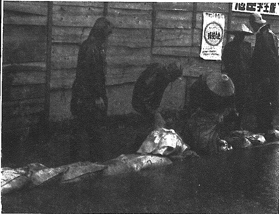
▲ 水があふれる西用水路