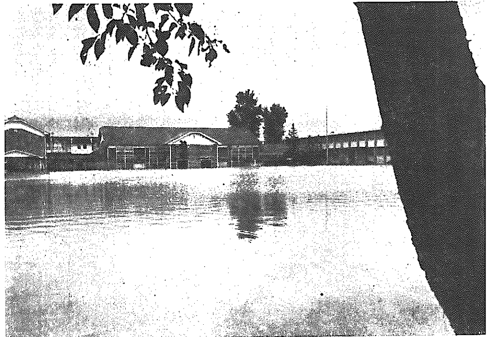
▲ 水びたしの庄瀬中学校

二十九日午前十一時ごろから信濃川が急激に増水、関係農家の必死の防壁も間にあわず濁流が侵入。