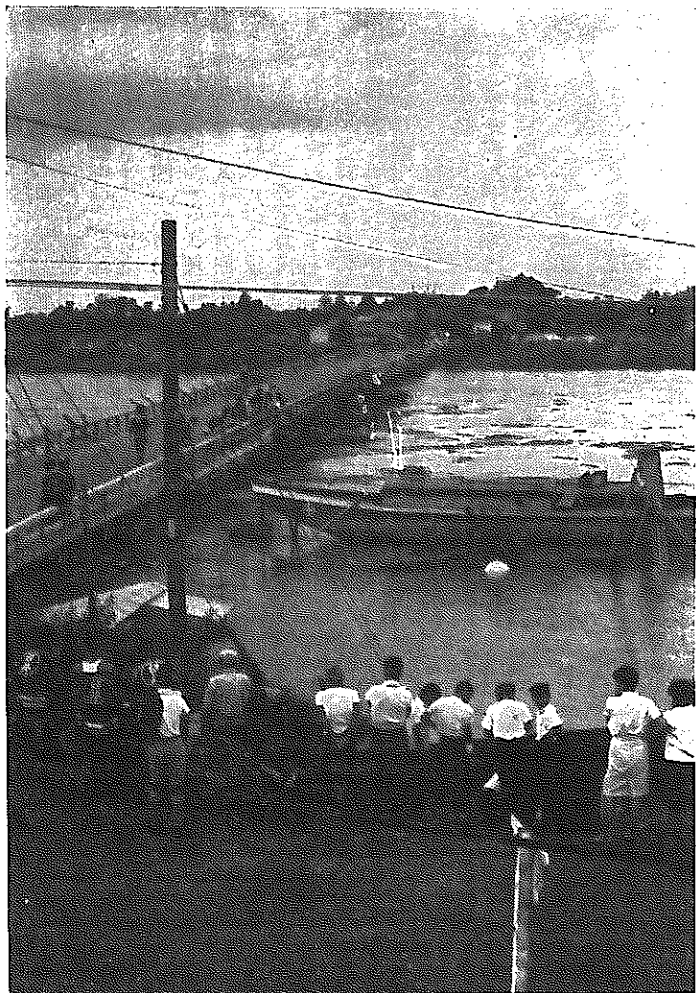
▲ 流失寸前の臼井橋