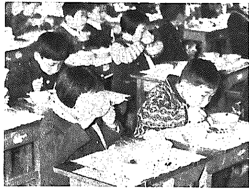
児童が食べる給食 市では、全校完全給食が実施できるよう年次計画で努力してきました。

市内ではじめて給食(ミルク)が行なわれたのは、昭和二十五年(大郷小学校)です。 そして、はじめて完全給食が行なわれたのはそれから十年後の三十五年(小林小学校)です。市では、全校完全給食が実施できるよう年次計画で努力してきました。