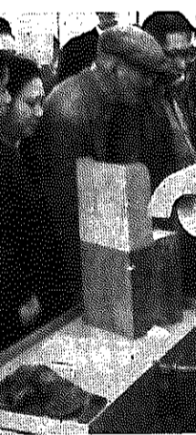
機械の説明を聞く見学者(理研工場)

新潟博前売券が売 り出されました 開港百年と震災復興を記念して、来年新潟博覧会が開かれます。その前売券が白根市に五千枚割当てになり、いま発売されています。 この入場券は一般券だけでなく、当日三百円のところ二百五十円での市内の商店や町内会などを通して売られ出されています。希望者は、前売券発売ポスターの掲示してあるところか、町内会の方においでになった時にお求めください。