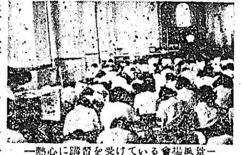
一熱心に講習を受けている会場風景

質問(一) 洋裁講座の感想 二十九人中、初心者にも判り易く説明してくれたと云ふ意見が圧倒的で十五人、更に「理論的説明で洋裁の原理を納得出来た」と云ふのが六人、「短期間で洋裁を習得出来た」と云ふ人が三人、「金がかからぬ」と云ふ人が一人、その他。