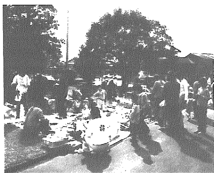
フリーマーケット

中央公民館では、10月30日(日)の2日間、公民館文化祭04を開催しました。今年、新たな試みとして1階の調理実習室を喫茶店に模様替えし、チャリティー喫茶コーナーを設けました。町内の料理クラブの協力により、30日の午前中、60食限定で手作りケーキと温かい飲み物をセットにして販売。混み合う時には出入り口に行列ができる程の盛況ぶりでした。また、2階の和室では30日、31日の午前中に様々なイベントが行われました。絵本の読み聞かせやエプロンシアター、町内