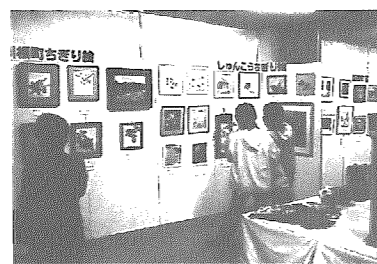
すばらしい作品が並んだ作品展

の語り部サークルによる昔話のライブなどが行われ、多くの子どもたちや親子連れの姿にぎわいました。一方、作品展においては、講堂にて町内の県展・芸展入選者などの作品を集めた、特別秀作展を開催。併せて、この夏に好評を博した「市村三男三遺作展」の一部再展示も行いました。一般作品展では、新たにちぎり絵サークル2団体や俳句団体が参加し、書道・水墨画・絵画・写真・文芸・子育てなどの各分野から多くの作品が集まりました。個人で出品した方も合わせると、約350点の作品があり、過去最高の出品数となりました。