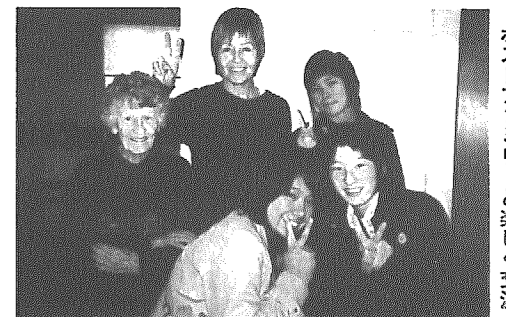
ホストファミリーと楽しく交流