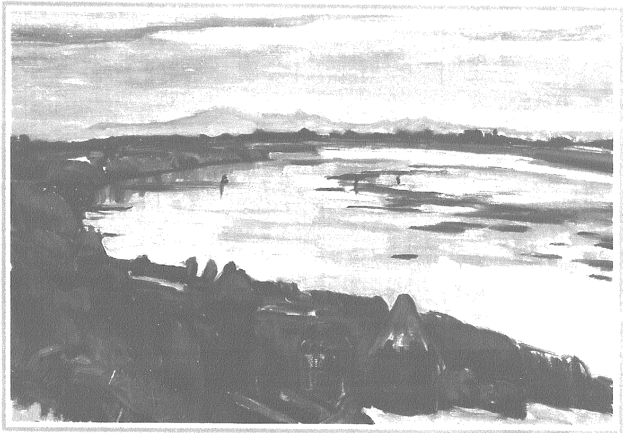
↑横越風景 1933年ころ 10号 椅子に腰かける男 (自画像) →