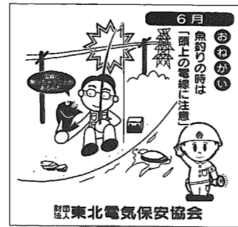
新潟電気保安協会