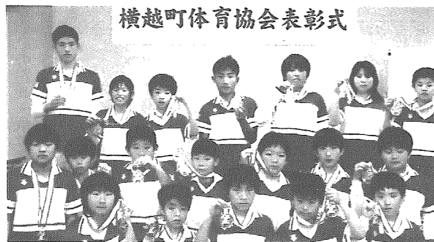
横越町体育協会表彰式 ドッジボール少年団 (ドッジボール)