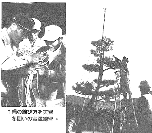
↑縄の結び方を実習 冬囲いの実践練習→

◆仕事の依頼・問い合わせ 横越町シルバー人材センター（サンウイング横越内） ☎385-5211