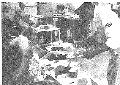
てんぶらバイキング

こうした医療ケア・日常サービスのほか、季節の行事としてお花見や納涼祭、敬老会、新年会などを行ったり、おそばやお寿司、天ぷらなどのバイキングといった食事の工夫、また、子どもたちの慰問なども受け入れ、家庭的な雰囲気の中で利用者の方々にも少しでも喜んでもらえるよう心がけています。