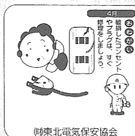
(財)東北電気保安協会