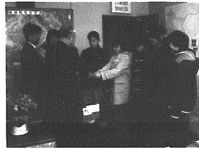
横越中地区の子どもたち

分水町おいらん道中 「おいらん役」大募集 分水桜まつりの「おいらん道中」の主役である「信濃太夫」・「桜太夫」・「分水太夫」の三太夫役を募集します。