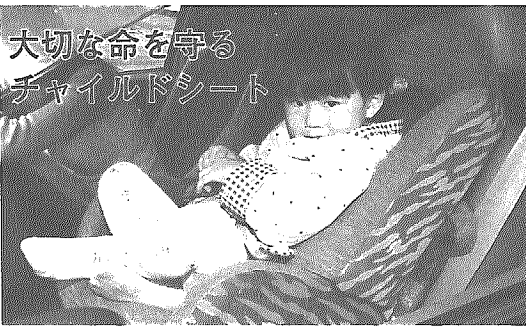
大切な命を守るチャイルドシート

道路交通法の改正により、平成12年4月から運転者が6歳未満の乳幼児を乗せて運転する場合、チャイルドシートの使用が義務化されました。 町では、チャイルドシートの普及促進と乳幼児の死傷事故防止を図るため、チャイルドシートの購入費の一部を補助します。