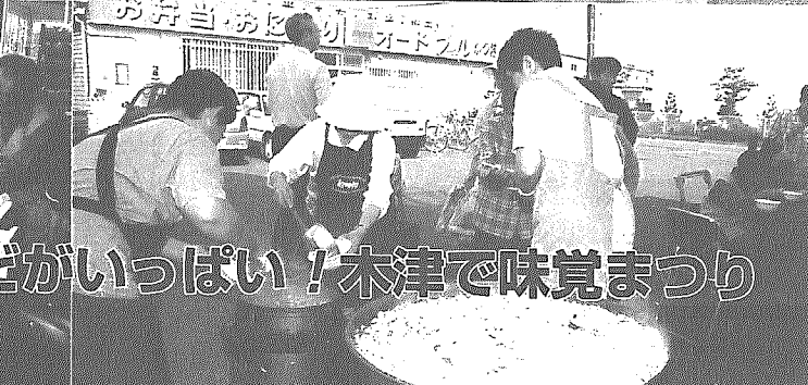
果物、野菜、きのこなどがいっぱい！木津で味覚まつり

10月7日、JA亀田郷みなみ木津倉庫前で、木津舞茸愛好会主催、町・JA亀田郷みなみ・木津地域公民館の後援により秋の味覚まつりが開催され、町内外から多くの人たちが訪れました。