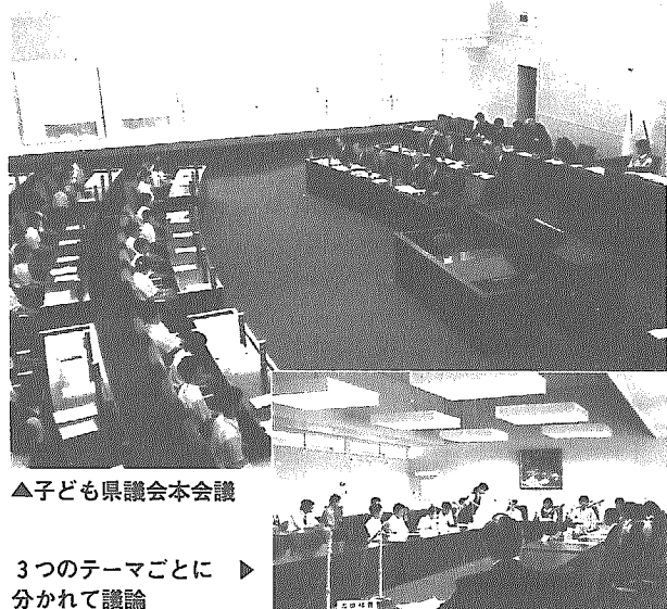
▲子ども県議会本会議

みんなが住みたいまちづくりをテーマに、他校の人たちの話を聞いたり、県会議員さんたちから色々なことを教えていただき、一生の思い出に残るものでした。