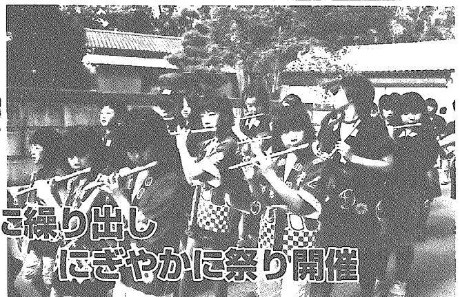
みこしや神楽が町内各地区に繰り出し にぎやかに祭り開催

8月25日、藤山・駒込・うぐいす地区で、子どもたちが中心になって行う夏祭りが開催されました。