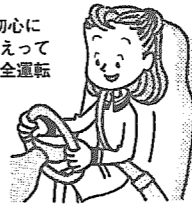
初心にかえって安全運転