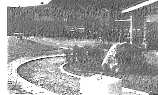
また、この地域周辺では、今後も石畳舗装などの整備を行っていく予定です。

沢海地区街なみ環境整備事業 沢海保育園跡地に「そらみ ふれあひひろば」完成 ゆとりといるおいのある住環境整備のため、平成10年度から整備が行われている沢海地区街なみ環境整備事業。すでに農村環境改善センター前の広場、北方文化博物館近くの道路の石畳、せせらぎなどの整備を行い、住民や観光客のみなさんから親しんでもらっています。 平成12年3月で閉園となった沢海保育園の跡地利用について、沢海地区住みよいまちづくり協議会や沢海地区公民館などの沢海地域の方々が相談を重ねた結果、地域みんなが集う公園をつくることで意見が一致。昨年9月から工事に着手し、このほど完成しました。 名称は「そらみ ふれあひひろば」です。 ひろばの施設は、園児バス待合所（休憩所）、トイレ、東屋（テーブル・ベンチ付き）、パーゴラ（藤棚・縁台付き）2基、ベンチ4基、水飲み場、自転車置き場があります。遊具は、コンビネーション遊具（ブランコ・滑り台）、アニマルスプリング遊具3基、砂場（抗菌砂使用）を配置。キンモクセイやアジサイなどの花の咲く木、クワなどの実をつける木、もみじやイチヨウなどの秋に紅葉する木をまわりに植えています。 子どもたちをはじめ、地域のみなさんの憩いの場として、きつと親しまれる公園となることとしましょう。