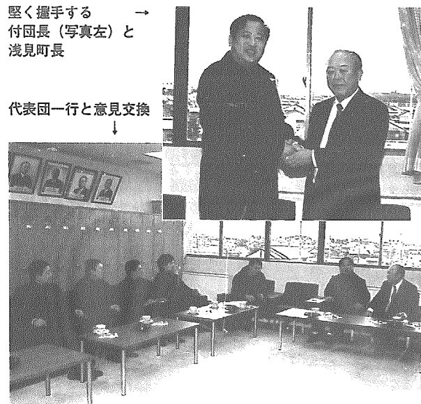
堅く握手する 付団長（写真左）と 浅見町長