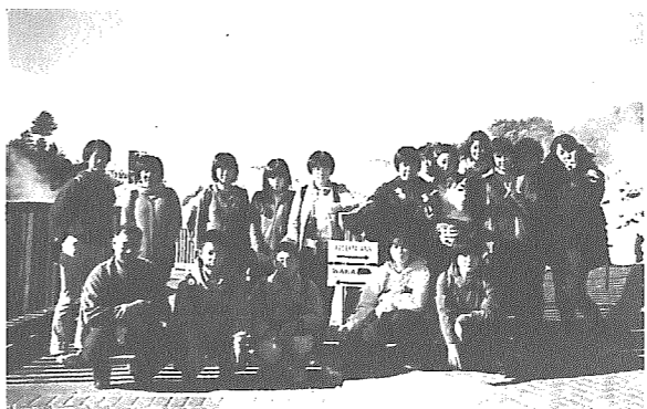
ロトルア間けつ泉の前にて