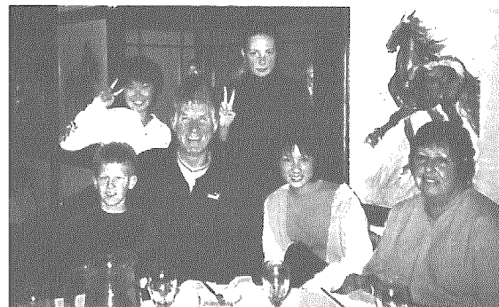
ホストファミリーとの夕食会にて