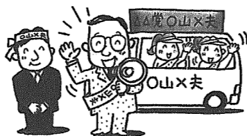
ルールを守って、明るい選挙

身体障害者手帳または戦傷病者手帳の交付を受けている人で、「郵便投票証明書」をお持ちの方は、郵便による不在者投票ができます。ただし、投票用紙等の請求は、投票日の4日前までです。