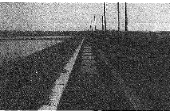
木津地内大蔵地から大規模農道沿いに横越方面に流れている大蔵地堀

一、正保二年(一六四五)、沢海藩領小杉村と新発田藩領横越村との間で、村の境界をめぐる言い争いがあった。 一、寛文二年(一六六二)、木津村の大蔵寺用水樋について、江下米を支払うことになった(解説1)。 一、寛文四年、横越の宗賢寺が御堂を建立した。