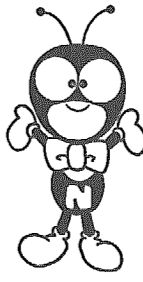
国民年金マスコットキャラクター ゆめありくん