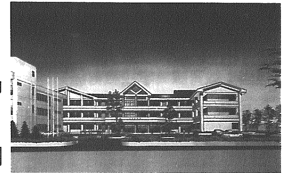
改築校舎の完成イメージ (中央・右)

中学校北・東校舎の改築に向けて、北校舎の耐力度調査を行います。平成14・15年度に改築する予定です。